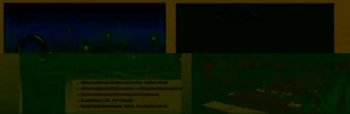
图 5-1-1 工程实践创新项目